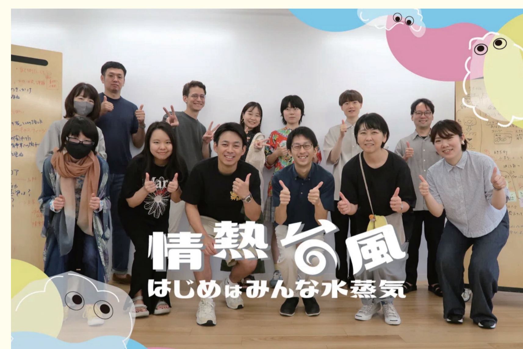
住む地域も年齢もスキルも様々な学生が共に学ぶスクーリング