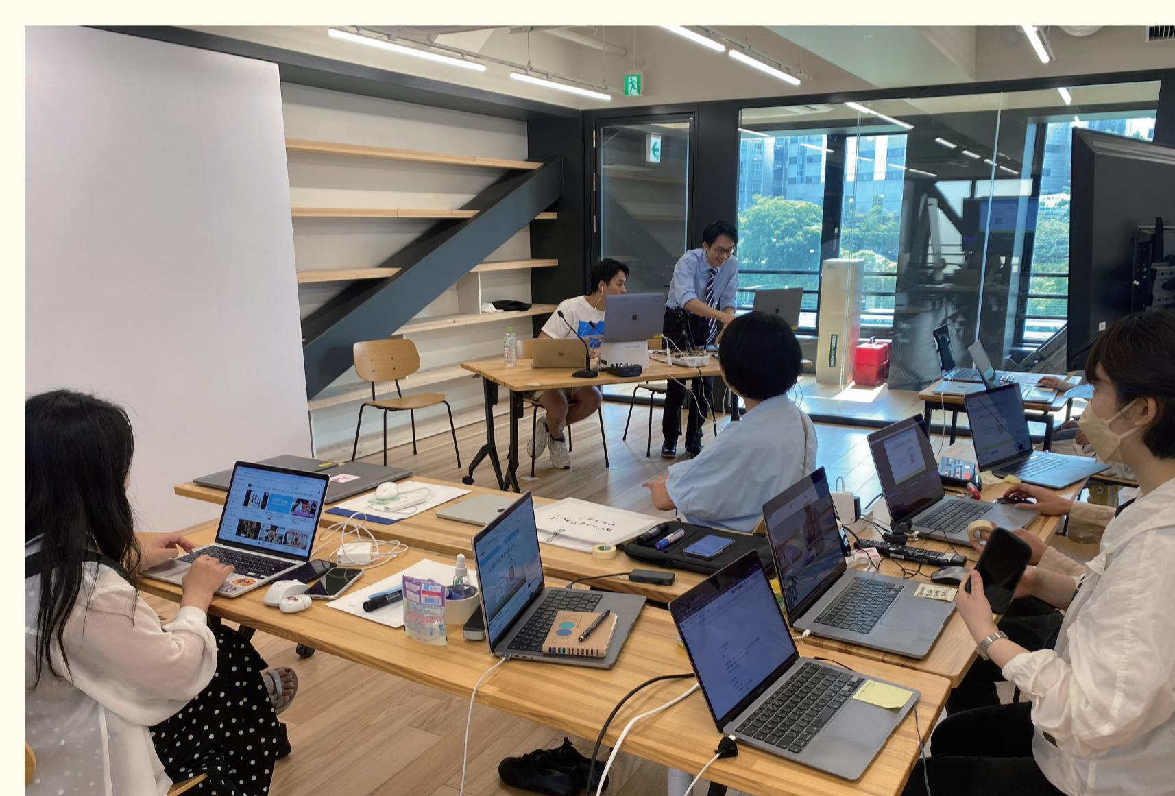
通信の卒業生2名をゲストにトークイベントを配信。授業ではMCや配信など、学生同士で役割を担当