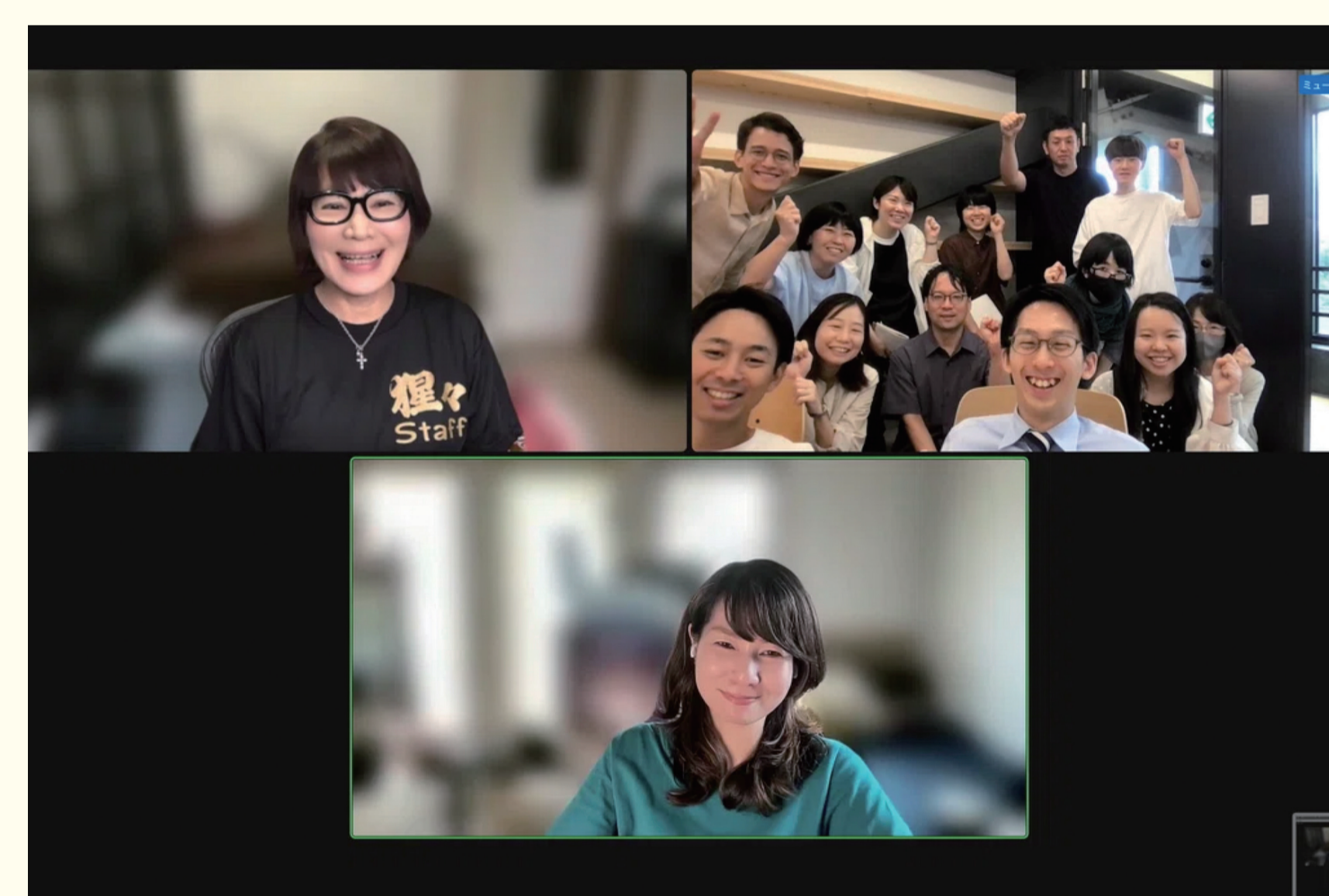
無事に配信完了し、ゲストとオンラインで記念撮影